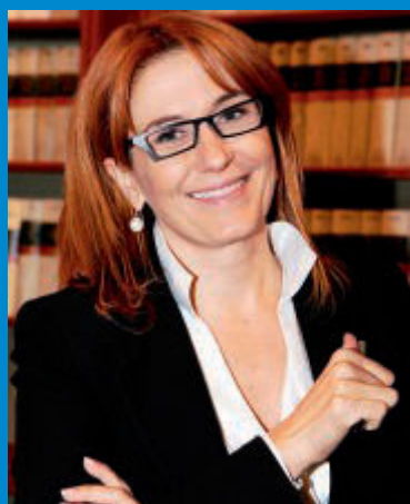
■ Monica Maggioni, presidente Rai

Sono alcuni dei dati più significativi emersi dalla ricerca "Lo stile di vita dei bambini e dei ragazzi" realizzata da Ipsos per Save the Children - l'organizzazione internazionale dedicata dal 1919 a proteggere i bambini in pericolo e tutelarne i diritti - e il Gruppo Mondelz in Italia.