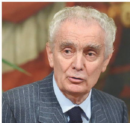
GIOVANNI ARVEDI In una foto d'archivio

L'idea di Arvedi è una società da 12 milioni di tonnellate di acciaio prodotte, con un fatturato fra i 7 e gli 8 miliardi l'anno, a cui non si esclude possa partecipare Marcegaglia (ora in cordata con la multinazionale Arcelor-Mittal per l'acquisto di Ilva) se i turchi di Erdemir - come sembra - dovessero fare un passo indietro dalla cordata con Arvedi, che ha presentato una manifestazione di inte-