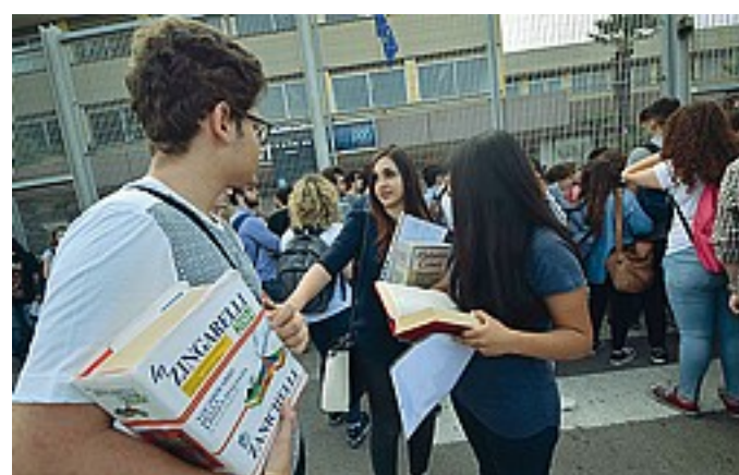
Ansiosi i ragazzi prima di entrare a scuola per la prova di italiano

A vigilare e monitorare sulla regolarità delle operazioni d'esame sono stati chiamati quattro ispettori.